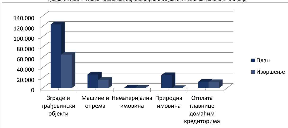
Графикон број 4: Приказ одобрених апропријација и извршења издатака општине Мионица

У консолидованом Билансу стања општине Мионица, исказани су издаци и то: (1) издаци за нефинансијску имовину у износу од 81.370 хиљада динара (класа 500000) и (2) издаци за отплату главнице и набавку финансијске имовине у износу од 11.446 хиљада динара (класа 600000)