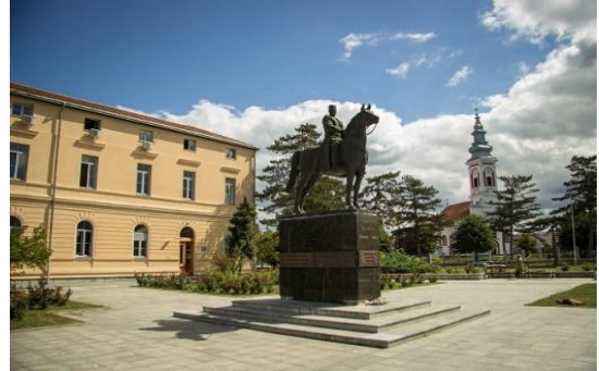
Слика бр. 1: Општина Мионица

Општина Мионица је општина која се налази у Колубарском округу у средишту западне Србије. Простире се од огранака Маљена и Сувобора ка северу до десне обале реке Колубаре, 80 км јужно од Београда у северозападном делу Србије. Захвата површину од 329 км 2 . Општина Мионица је један од најважнијих административно-политичких центара ваљевског краја и територијално се граничи са општинама Љиг, Ваљево, Лајковац, Горњи Милановац и Пожега. Центар општине је град Мионица. Општина Мионица се састоји од 36 насељених места: Берковац, Брежђе, Буковац, Велика Маришта, Вировац, Вртиглав, Голубац, Горњи Лајковац, Горњи Мушић, Гуњица, Доњи Мушић, Дучић, Ђурђевац, Клашнић, Кључ, Команице, Крчмар, Маљевац, Мионица, Мионица (село), Мратишић, Наномир, Осеченица, Паштрић, Планиница, Попадић, Радобић, Рајковић, Ракари, Робаје, Санковић, Струганик, Табановић, Тодорин До, Толић, Шушеока. 9